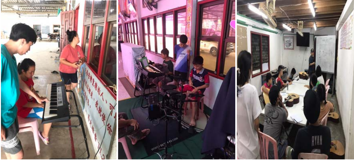
青年團契——小組分享，今年年輕人數約 70 位